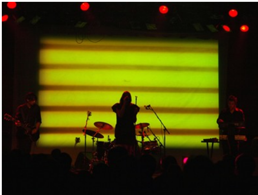
Concert Visuals Division Kent