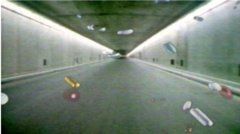
Experimental Video Der Gotthard Tunnel ist Schwarz

Zentralstrasse 18, 8003 Zurich Switzerland Tel. +41 43 542 6283 Mobile + 41 76 577 0854 info@mondejargallery.com www.mondejargallery.com Gallery Hours: Tues-Fri 16-19, Sat 14-18 Uhr or by appointment