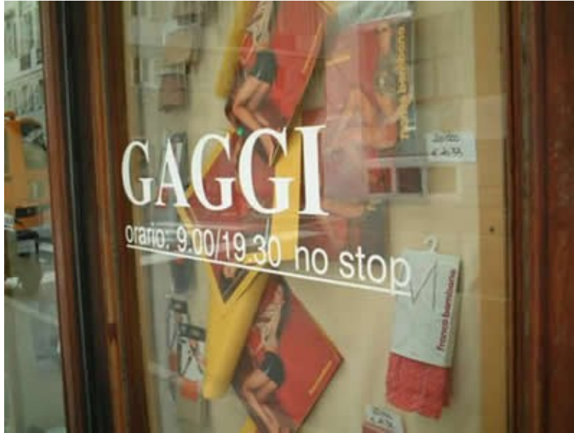
Solo Exhibition GaggiNoStop