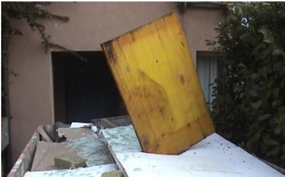
Movie Sieben Mulden und eine Leiche